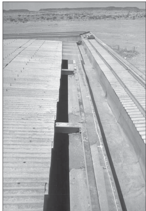
Abb. 7: Die ersten Platten sind auf der nördlichen Längsseite verlegt.

Damit hat die Sanierung des Daches (Abb. 12) dieses wichtigsten Kulturdenkmals aus der frühmeroitischen Periode von Kusch ihren Abschluss erfahren. Nunmehr stellt sich der Apedemaktempel in wahrstem Sinne des Wortes in „neuem Licht“ dar. Die Innenreliefs erhalten wieder genügend Streiflicht von oben, sie sind dadurch erneut hervorragend sichtbar und vor allem gegen eindringendes Regenwasser geschützt. Vermutlich bedarf das Dach in den nächsten 15 - 20 Jahren keiner weiteren Reparatur mehr.