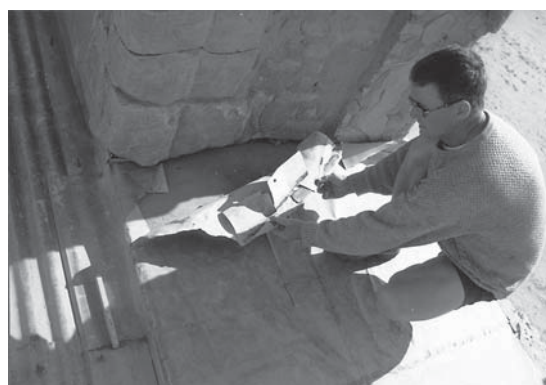
Abb. 11: Die schadhafte Zinkabdeckung zwischen den Pylontürmen.