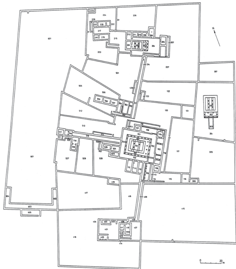
Plan 1: Grundriss der Großen Anlage von Musawwarat es Sufra.

Die Hauptarbeit aber war das Abtragen eines Mauerstückes, das sich mit einem tiefen, auf beide Schalen erstreckenden Riss gefährlich zur Seite neigte und abzustürzen schien. Es handelt sich um die Mauer 223/218 (Abb. 14). Nachdem die Wand von beiden Seiten steingerecht dokumentiert worden war, wurden die Steine nummeriert und entsprechend ihrer Position abgebaut und gelagert, damit im darauffolgenden Jahr der Wiederaufbau reibungslos vonstatten gehen könne.