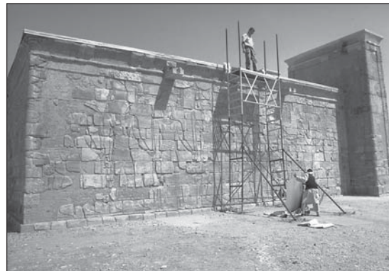
Abb. 3: Gerüst an der Südseite des Apedemaktempels (Foto: R. Wenig).

Diese Arbeiten waren notwendig geworden, weil die 1969/70 beim Wiederaufbau des Apedemaktempels montierten Perspex-Platten aus DDR-Produktion im Laufe der vergangenen 35 Jahre spröde