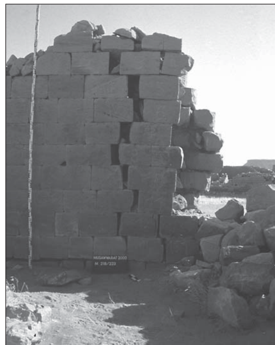
Abb. 14: Große Anlage: Die einsturzgefährdete Mauer 223/218, (Foto: Archiv)