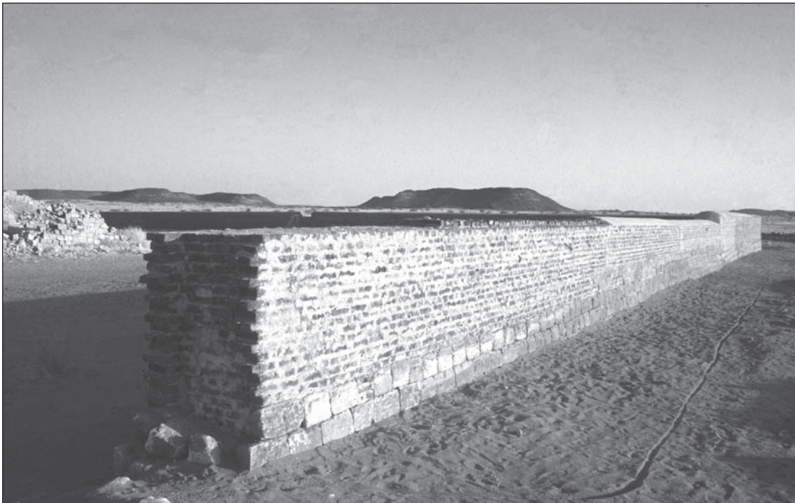
Abb. 13: Große Anlage: Die 2000 wieder aufgebaute Umfassungsmauer, die den Hof 227 im Osten begrenzt.

aber eine Vielzahl von Restauratoren und weiteren Spezialisten benötigt wird, was wiederum erhebliche Finanzmittel voraussetzt. Eine Lösung des Problems, soll es grundsätzlich angegangen werden, kann aber wohl nur mit Hilfe internationaler Organisationen erfolgen. Dies würde für den Fall, dass die Ruinen von Musawwarat es Sufra in die UNESCO-Liste des Weltkulturerbes aufgenommen werden, durchaus in den Bereich des Möglichen rücken.