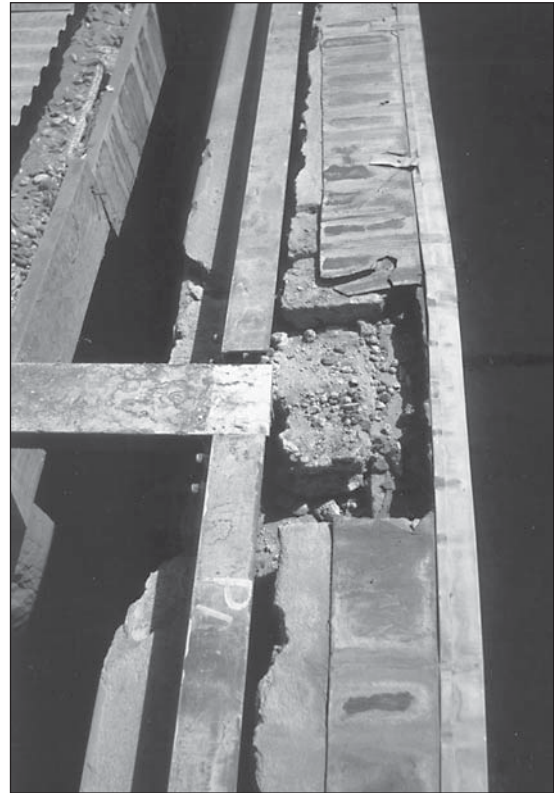
Abb. 6: Schadstelle an der nördlichen Längsseite nach Abnahme der Perspex-Platten.

Schmied erhältlich sind. Der Haken befindet sich unter dem Blech und zieht die Platten an das Winkeleisen. Er wird oben, wo er durch das Blech durchstößt, mit einer Mutter befestigt. Als Schutz gegen Regenwasser wird unter die Mutter eine Gummidichtung gelegt.