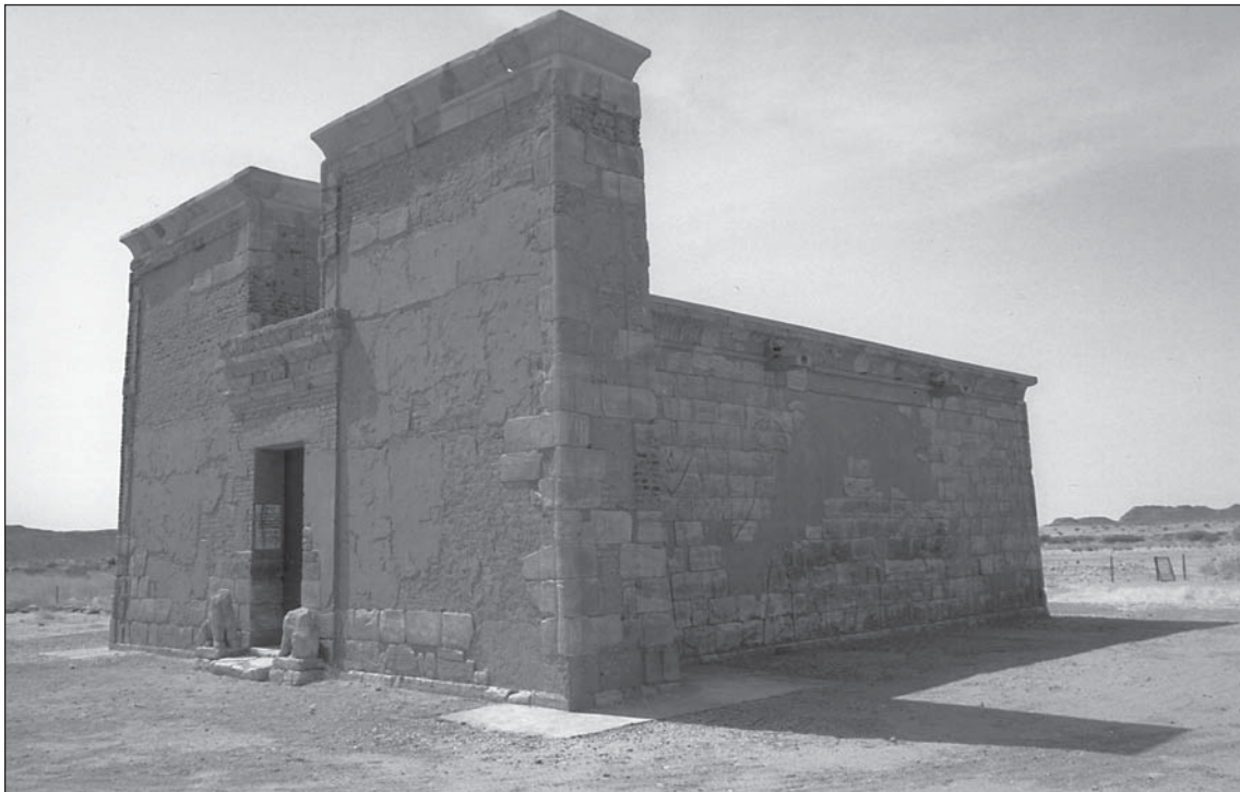
Abb. 1: Der 1969/70 wieder aufgebaute Apedemaktempel von Südost.

Schon 1995 wurde mit Reparaturen des Daches von Apedemaktempel begonnen (Abb. 2), doch es dauert bis zum Jahr 2000, bis diese Arbeiten abgeschlossen werden konnten.