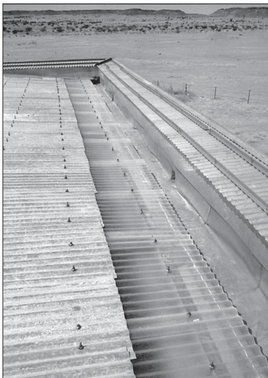
Abb. 12: Das sanierte Dach des Apedemaktempels.