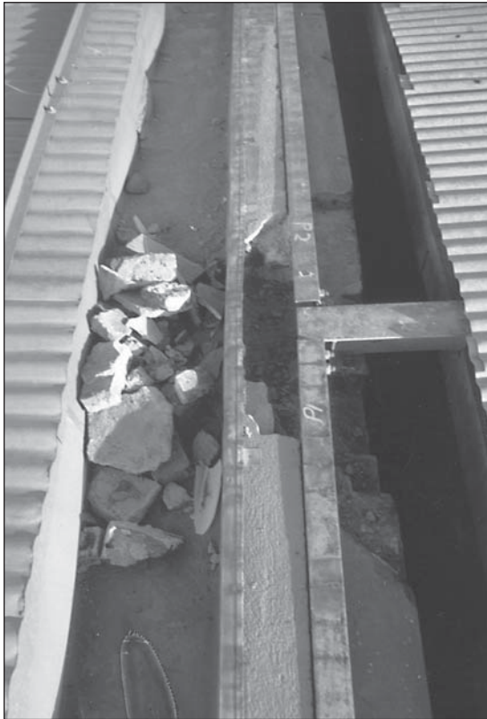
Abb. 5: Schadstelle an der südlichen Längsseite nach Abnahme der Perspex-Platten.