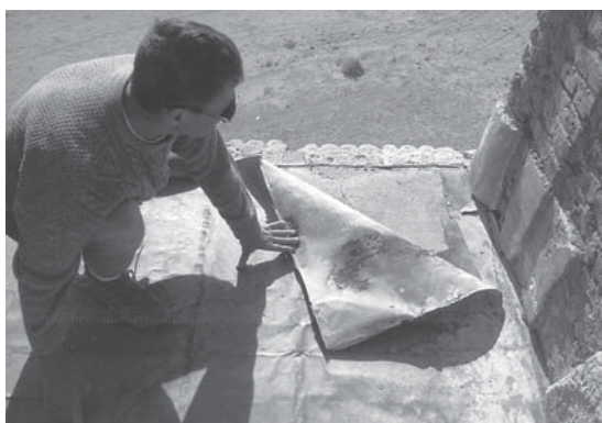
Abb. 10: Die schadhafte Zinkabdeckung zwischen den Pylontürmen.